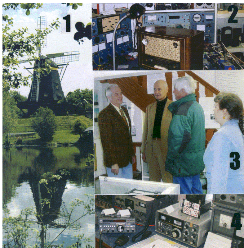
Abb. 1: Windmühle im Freilichtmuseum „Hessenpark“