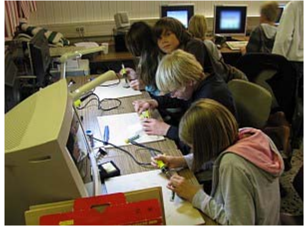
Foto vom Feriencamp 2010

Wegen der großen Resonanz hat der VFDB nach Wegen gesucht, auch für den eigenen Vereinsnachwuchs ähnliche Möglichkeiten zu schaffen. Nach einigen sehr positiven Gesprächen mit dem SV91 kann der VFDB erstmals in diesem Jahr ein Ferienlager für den VFDB-Nachwuchs anbieten. Ausgerichtet wird das Camp vom SV91 in Münster. Die Inhalte sind, neben allerlei Spiel- und Sportaktivitäten, natürlich technische Themen, die allerdings konsequent auf die Altersgruppe der Teilnehmenden abgestimmt sind. Auch bei diesen Themen werden Spaß und Unterhaltung nicht zu kurz kommen (schließlich sind Ferien!)