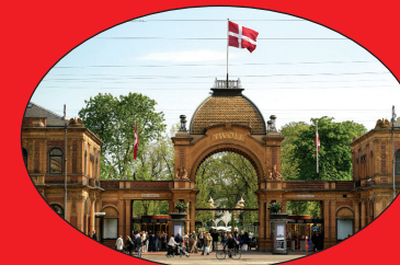
Tivoli in Kopenhagen