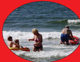
Lange Badestrände in Westjütland