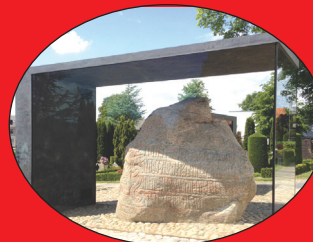
1000 Jahre alte Runensteine in Jelling