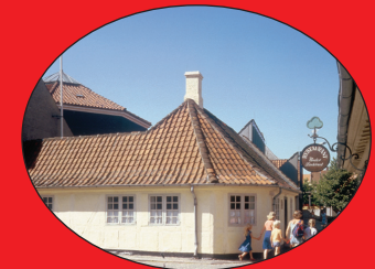
H. C. Andersens Haus in Odense

Weitere Informationen unter www.VisitDenmark.dk