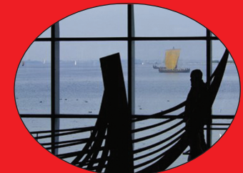
Wikingerschiffe in Roskilde